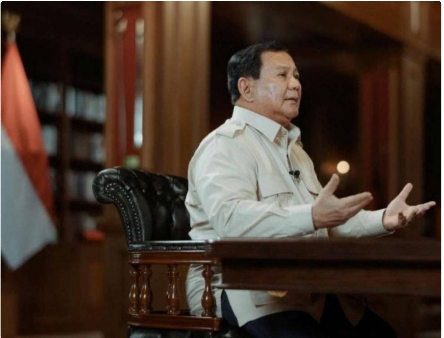
Prabowo Subianto Presiden RI 2024-2029

PENDIDIKAN - Indonesia dikenal sebagai negara yang kaya akan sumber daya alam. Dari hasil tambang yang berlimpah, laut yang luas dengan kekayaan hayati yang melimpah, hutan yang menjadi paru-paru dunia, hingga sumber daya energi yang tersebar di berbagai wilayah, semuanya menjadi kekuatan besar bagi bangsa ini. Potensi besar tersebut seharusnya dapat dimanfaatkan untuk