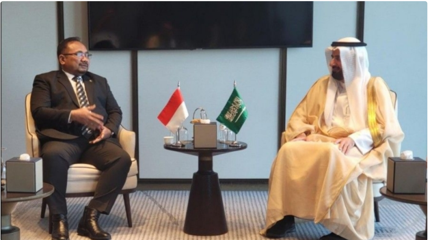
Menag Yaquut bertemu Menteri Haji Arab Saudi Tawfiq F. Al Rabiah, di Jeddah.

JAKARTA - Indonesia dan Pemerintah Kerajaan Arab Saudi telah menandatangani kesepakatan penyelenggaraan ibadah haji 1444 H/2023 M. Kesepakatan tersebut ditandatangani hari ini oleh Menag Yaquut Cholil Qoumas bersama Menteri Haji dan Umrah Arab Saudi Tawfiq F Al Rabiah di Jeddah.